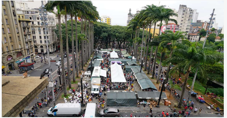
Vista geral do evento na Praça da Sé