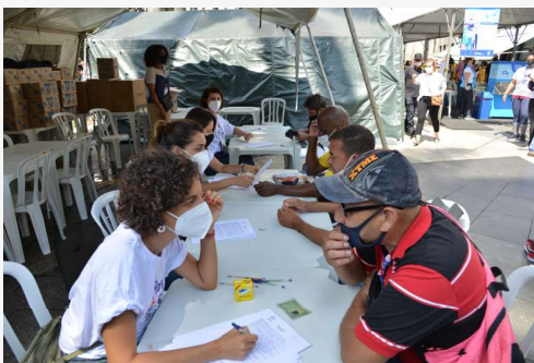
Pessoas são atendidas no posto do Juizado Especial Federal