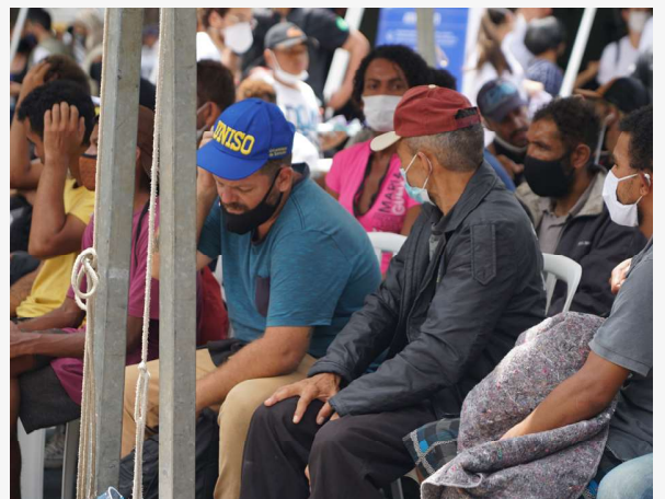
Pessoas aguardando atendimento