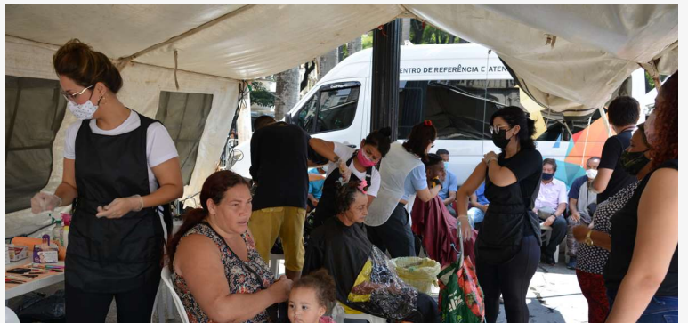
Entidades de ajuda humanitária estiveram presentes