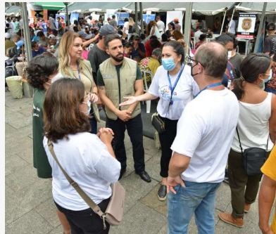
Juízes, juízas, procuradores e colaboradores conversam no evento